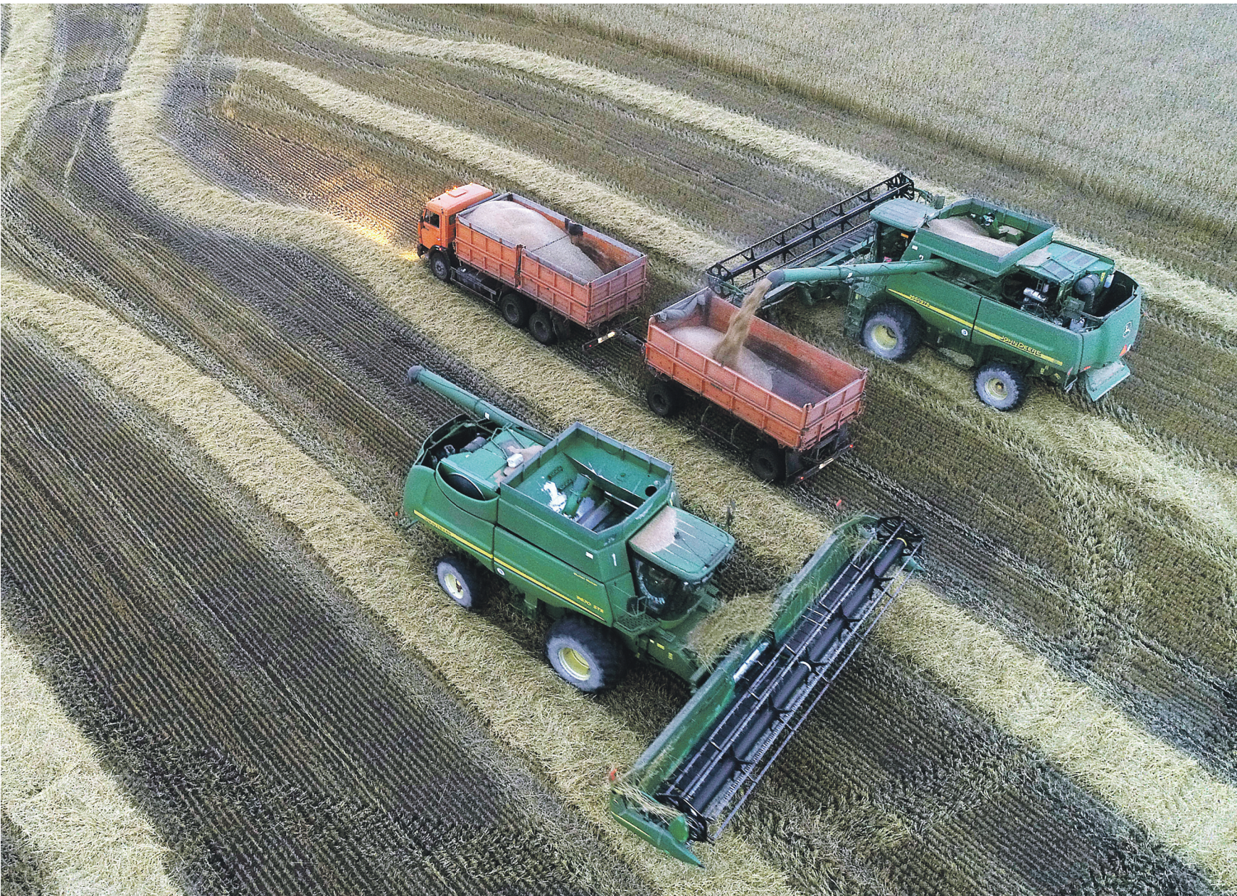
ИЗБАВЛЯЮЩАЯСЯ ОТ НЕЖЕЛАННОЙ ПОЖАТЫ

ПЕРСПЕКТИВА В России ожидают рекордный урожай зерновых. Помешают ли санкции получить хорошую прибыль