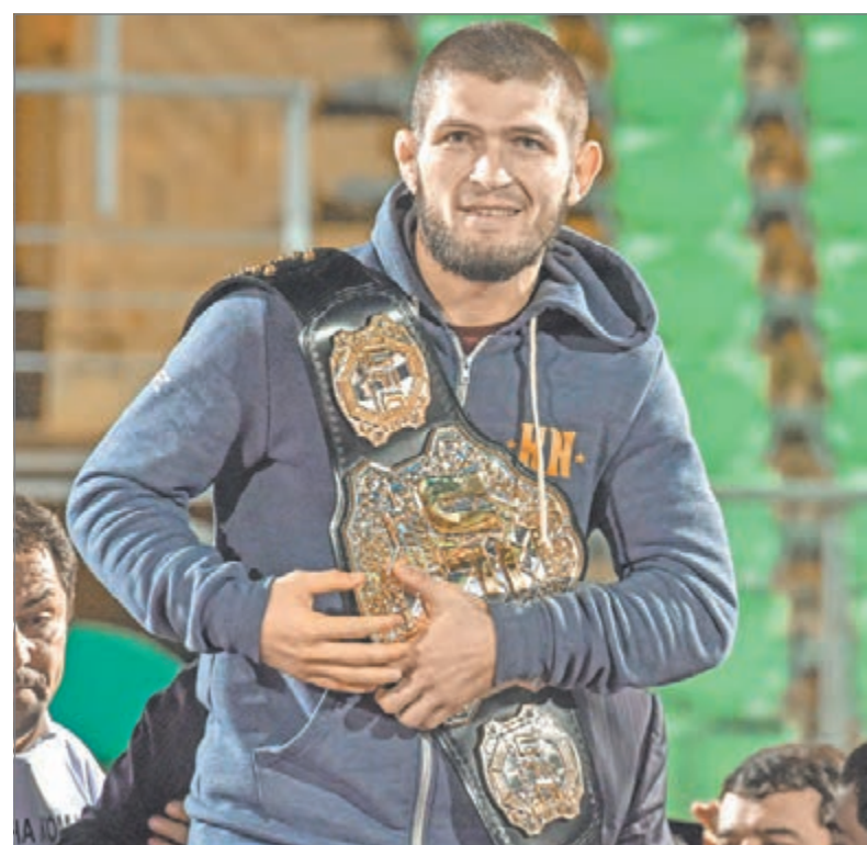
Чемпион UFC в легком весе Хабиб НУРМАГОМЕДОВ.

Самый популярный российский боец Хабиб Нурмагомедов начал переговоры о поединке с легендой бокса Флойдом Мейвезером. Бой может пройти в «Лужниках» и стать главным событием будущего лета. Хотя даже во время дисквалификации наш чемпион не сможет выступать без санкции своих американских работодателей.