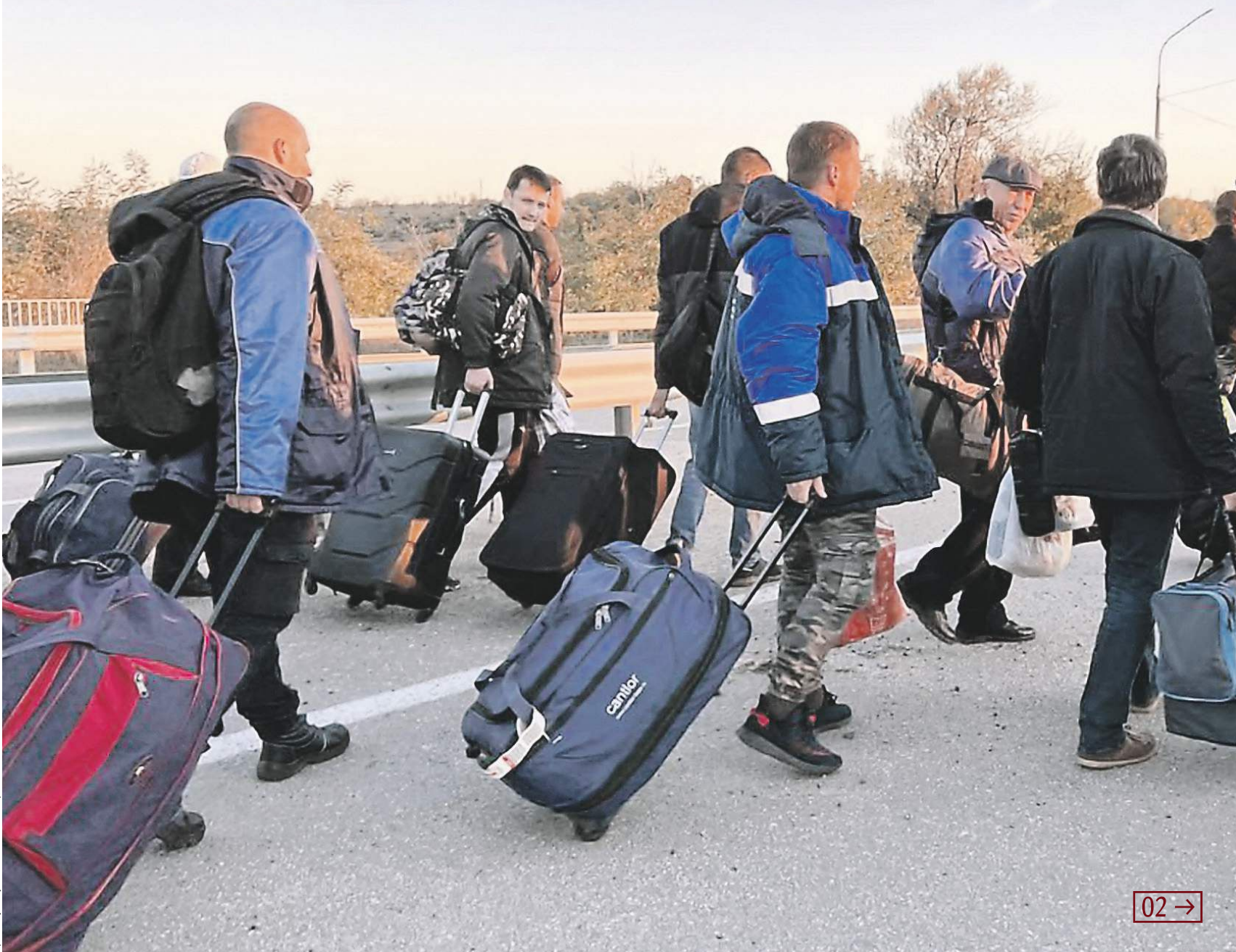
Пресс-служба украинского пограничного пункта в РФ

РФ вернула с Украины 168 дальнобойщиков и моряков