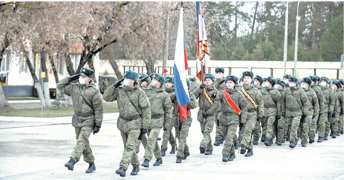
Вынос Боевого Знамени в одной из частей танкового объединения

Первый час занятий в новом периоде посвятили роли России в современном мире и развитию нашей страны