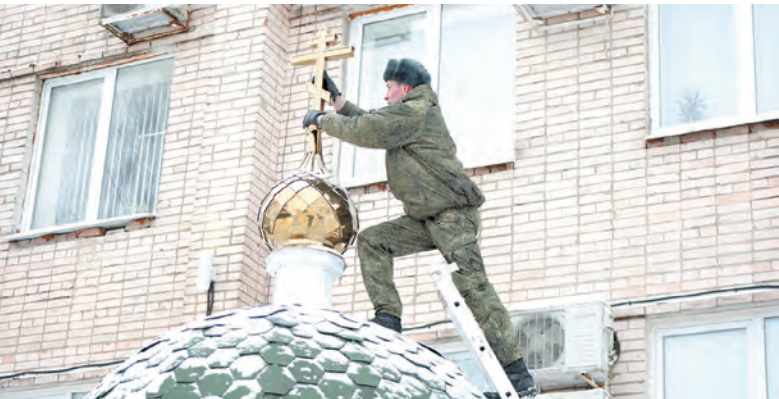
В штабе армии ВВС и ПВО появилась часовня. Посещать её смогут не только военнослужащие, но и жители города Пушкина

— Сегодня в Вооружённых Силах РФ начался зимний период обучения. Нам предстоит приложить максимум сил для повышения боевой готовности, уровня слаженности подразделений и воинских частей, совершенствования индивидуального мастерства. С удовлетворением отмечаю, что личный состав гвардейской танковой армии достойно проявил свои боевые возможности в ходе совместного российско-белорусского стратегического учения