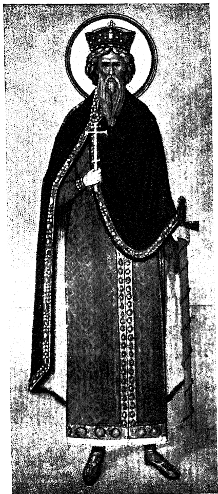
Свѣтый равноапостольный великій кнѣзь ВЛАДИМИРЪ, принявшій Св. Крещеніе въ Кіевѣ въ 988 г. и распространившій Православную вѣру прежде всего на Суздальскую землю 1) .