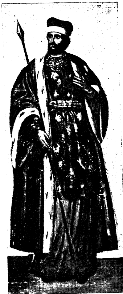
Свѣтый благовѣрный великій кнѣзь АНДРЕЙ Боголюбскій, посадившій первый корень Самодержавной власти въ Русской землѣ.

„Святая Православная вѣра и Само- державная власть—двѣ основы, на кото- рыхъ начиналось, укрѣплялось, зиждется и благоденствуетъ наше необозримое моу- щественное Россійское Государство“.