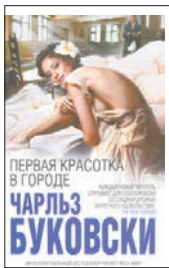
Буковски Ч. Первая красotka в городе / Пер. с англ. М.Немцова. М.: Эксмо; СПб.: Домино, 2011. — 400 с.

4 Буковски по праву считается мастером короткой формы, и его сборник «Первая красotka в городе», составляющий своего рода двухтомник с классическими «Историями обыкновенного безумия», — яркое тому подтверждение: доводя свое фирменное владение словом до невероятного совершенства, Буковски проводит лирического героя, бабника и пьяницу, по всем кругам современного ада.