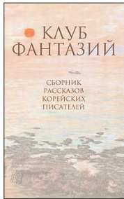
Клуб фантазий / Пер. с кор. И.Нигай. СПб.: Гиперион, 2011. — 376 с. — (Современная корейская литература).

5 Современная корейская литература, в отличие от кинематографа, практически неизвестна отечественному читателю. Мы, как ни странно, лучше знаем их поэзию IX—XV веков, чем нынешних авторов. Данный сборник знакомит с образцами корейской художественной прозы веков XX—XXI.