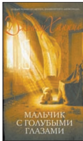
Харрис Дж. Мальчик с голубыми глазами / Пер. с англ. И.Тогоевой. М.: Эксмо; СПб.: Домино, 2011. — 592 с.

6 Очередная фантазия миссис Харрис — странное сплетение тем. Интернет-культура, потакающая анонимности, с одной стороны, и маньяк-убийца — с другой. Впрочем, это перестает казаться странным, когда речь заходит об основной теме — синестезии. И, как всегда у Харрис, везде призраки прошлого.