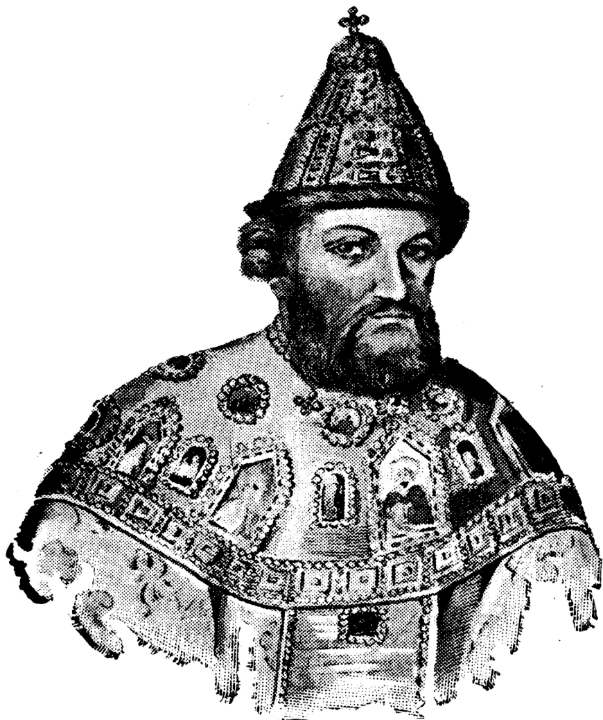
Царь и Великий князь, Самодержецъ всея Руси, Михаилъ Ѳеодоровичъ. 1613 годъ.