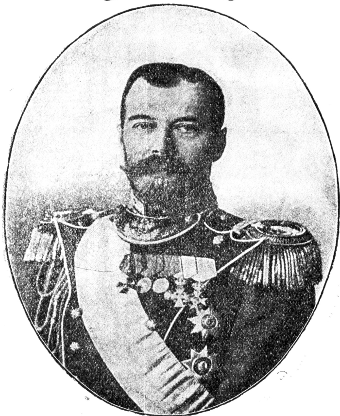
Государь Императоръ, Самодержецъ Всероссійскій, Николай II.