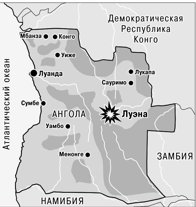
Территории, выделенные на карте, контролируются повстанцами. (Карта предоставлена представителями УНИТА)

Многие официальные лица в России и Анголе пытаются свести эту трагедию в разряд обычных авиакатастроф. Но их за послед-