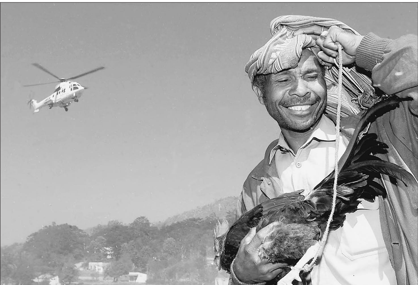
Последнее африканское предупреждение

Представители повстанцев и до этого в интервью газете «Известия» заявляли, что все эти люди, включая военных летчиков, защищают несвободу. Поэтому