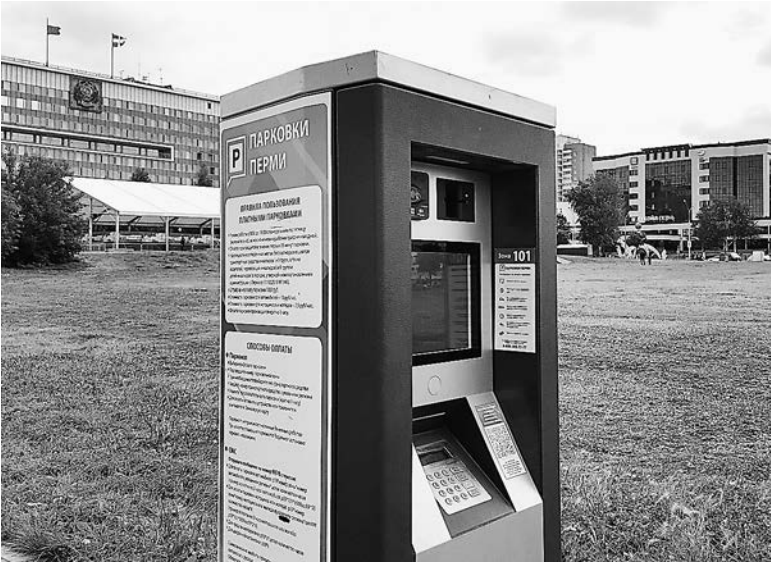
Только 10 процентов пермяков при оплате парковки пользуются паркоматами.

В прошлом году обозначилась еще одна проблема—неоплата парковки путем скрытия идентификационных номеров транспортного средства. В центре Перми часто можно увидеть автомобиль, часть номера которого прикрыта бумажкой. Бывает, один из номерных