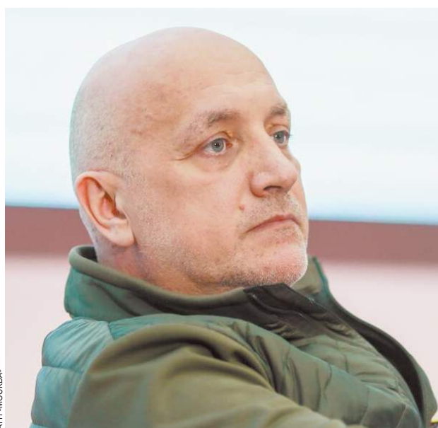
«Я СУМЕЛ СЕБЕ ЗАРАБОТАТЬ НА ИСПОЛНЕНИЕ ВСЕХ СВОИХ ЖЕЛАНИЙ» Захару Прилепину исполнилось 50 лет