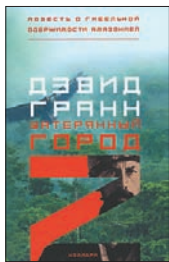
Гранн Д. Затерянный город Z. Повесть о гибельной одержимости Амазонией / Пер. с англ. А.Канападзе. М.: Колибри, 2010. — 480 с.