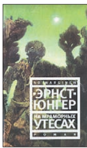
Эрнст Ю. На мраморных утесах: Роман / Пер. с нем. и послесл. Евгения Воропаева. М.: Ад Маргинем Пресс, 2009. — 256 с.

6 Это история о прекрасной, но обреченной Большой Лагуне, страшном Старшем Лесничем и неминуемой смене эпох. Первый художественный роман одного из самых замечательных писателей-философов ушедшего столетия, Эрнста Юнгера, сразу же стал «культовым» для всей читающей Европы 40-х.