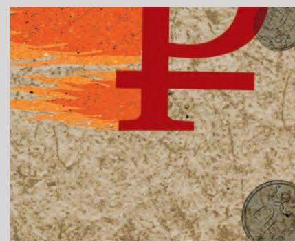
КОЛПАК: КРИПТ РУБЛЮВ

Избыточная подвижность курса подбивает функцию рубля как средства сбережения. Не случайно с весны 2013 года фактически остановился рост депозитов населения в банковской системе в реальном выражении, а доля валютных вкладов медленно, но верно ползет вверх, к началу осени вплотную подобралась к 20-процентной отметке. Мало того, ЦБ развернул безжалостную чистку банковской системы, да еще курс пляшет, как укушенный. Для хозяйственных игроков высокая неопределенность краткосрочной динамики курса также контрпродуктивна — снижает надежность инвестиционных планов либо требует затратного хеджирования.