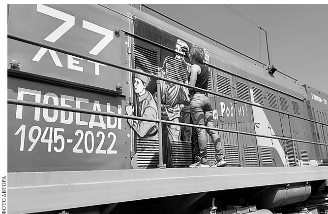
На бортах локомотива — репродукции фотоснимков 1945 года: советские солдаты возвращаются с победой домой.

На тепловозоремонтном заводе она трудилась всю неделю по семь часов в день. И вот, когда рисунок просох, обновленный тепловоз покинул ангар. И победно засиял в лучах вышедшего из-за туч яркого астраханского солнца.