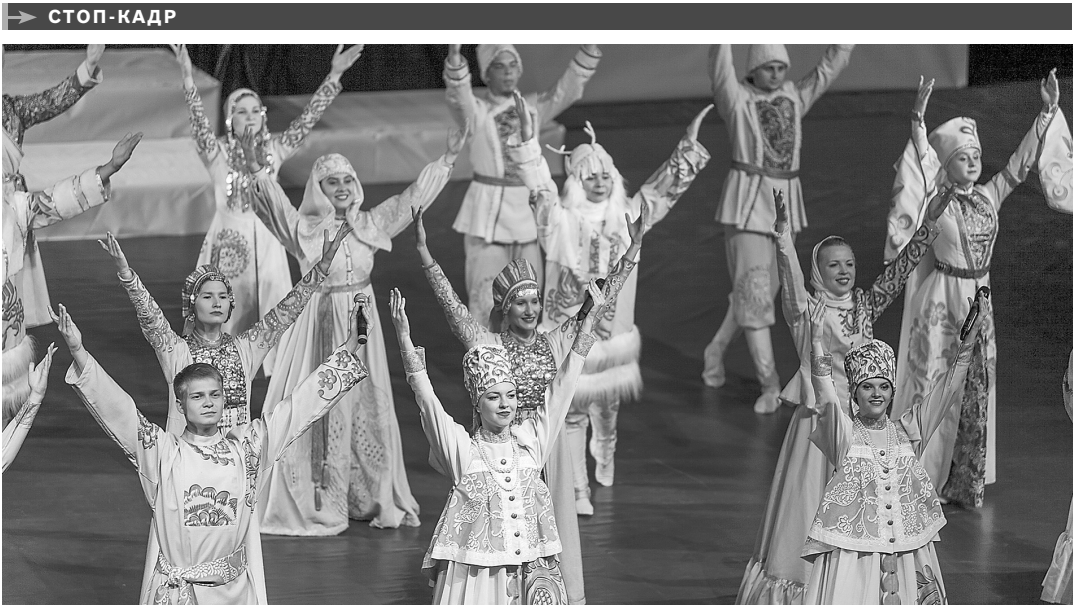
В Ростове-на-Дону прошел XI фестиваль «Молодежь—за Союзное государство». Яркий, искрометный молодежный форум стал масштабным мероприятием в жизни не только всего города, но и заметным событием для участников из дружественных государств.

525 МИЛЛИОНОВ рублей направили региональные власти на закупку новых низкопольных трамваев. Администрация города провела аукцион, в котором победило ООО «ПК Транспортные системы». До 30 ноября трамваи закупят. Салоны электротранспорта будут оснащены кондиционерами и отоплением, а также системой видеонаблюдения и автоматической системой пожаротушения.