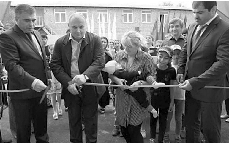
Традиционную ленточку вместе с чиновниками перерезали новоселы.

прибыл градоначальник Муса Мусаев. —Пусть это жилье будет для вас удобным, оставайтесь рядом с нами, и вместе мы сделаем этот город комфортным и уютным, — сказал Муса Мусаев. Всего в рамках программы переселения горожан из аварийного жилья в Махачкале строятся пять многоквартирных домов. В текущем году планируется сдать 627 квартир. Али Бабаев, Махачкала