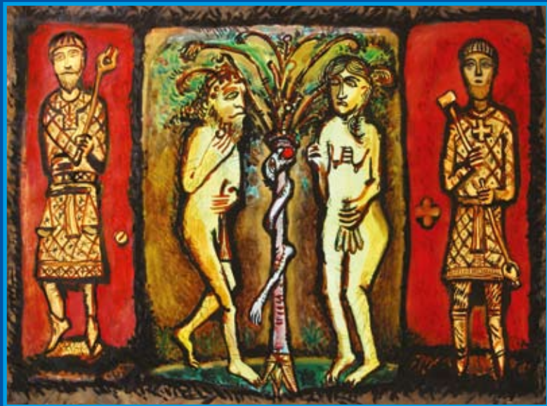
МАСТЕРА. Смешан. техника Н.Л.