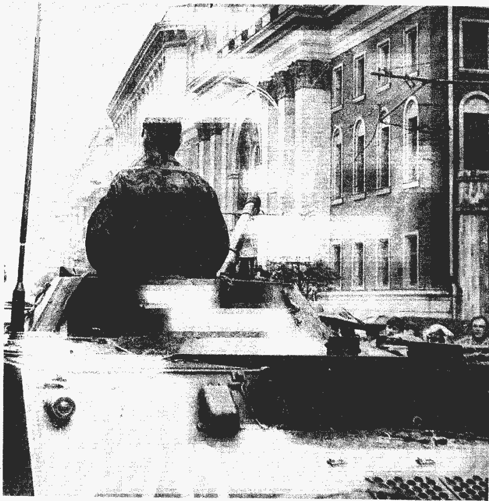
Орудия хунты направлены на Моссовет