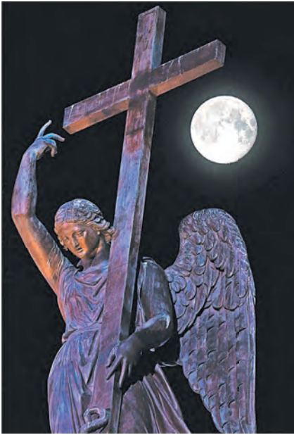
Так выглядело суперлуние в ночь на понедельник в Санкт-Петербурге.