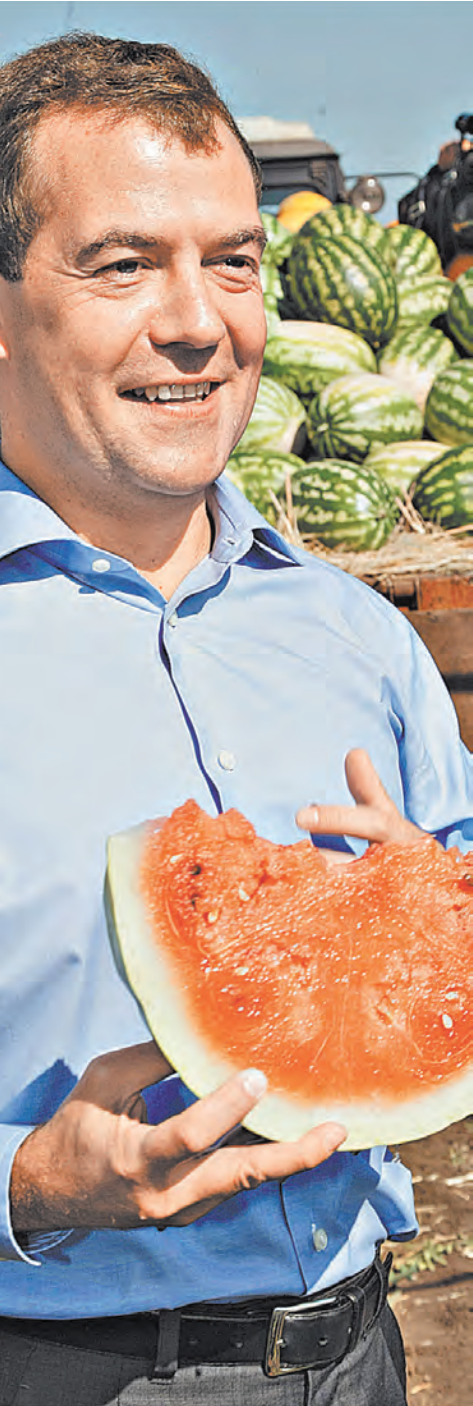
Премьер уверен: Россия вполне может сама себя прокормить и незачем покупать за границей то, что можем вырастить сами