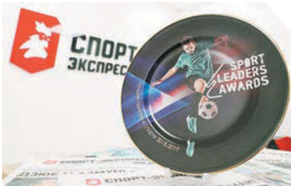
Федор Успенский «СЗ» / Canon EOS-1D X Mark II