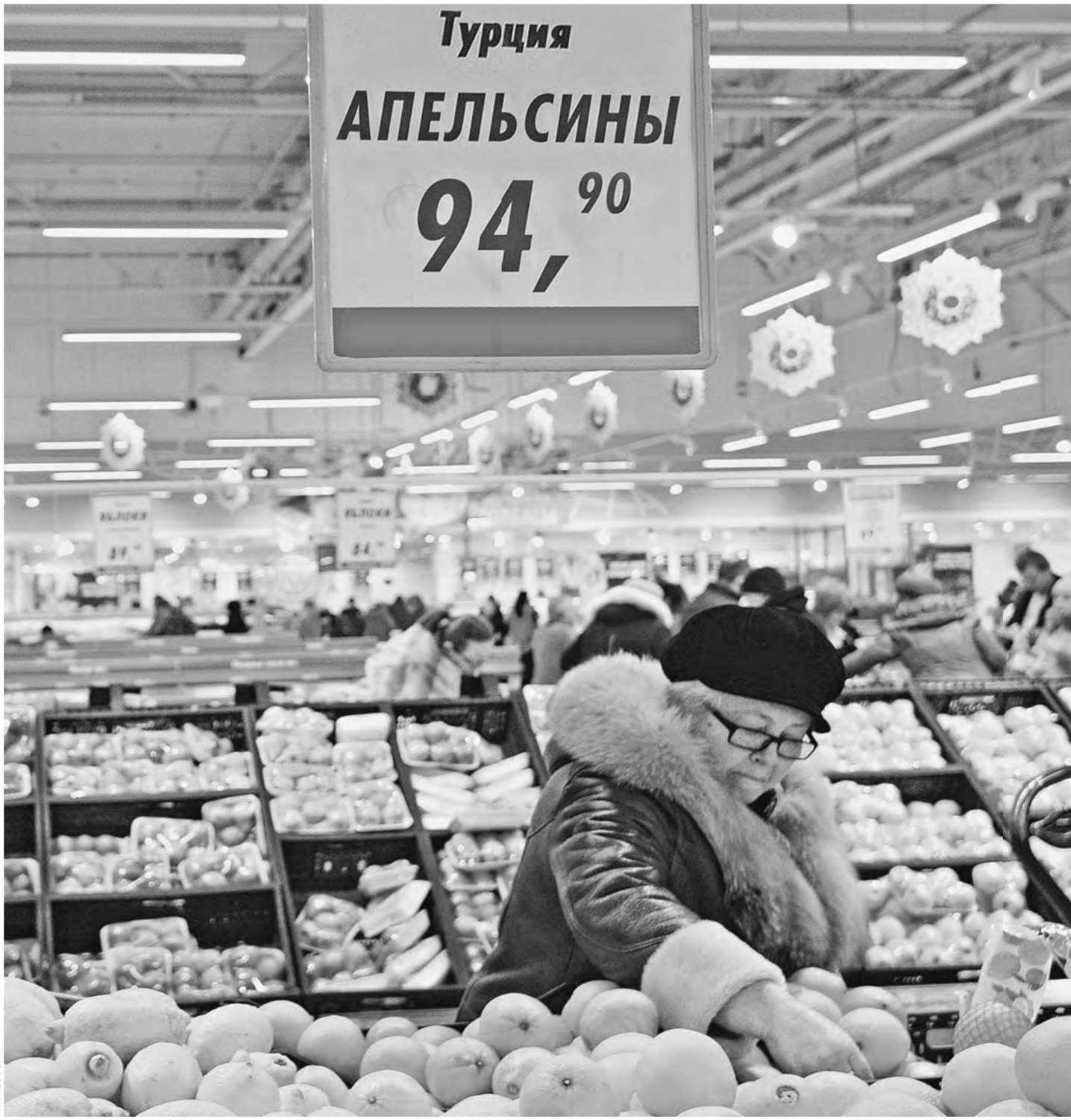
Минпромторгу поручено подумать о введении ограничений и на ввоз турецких продуктов.

УТРАТА Нас покинул Эльдар Александрович Рязанов