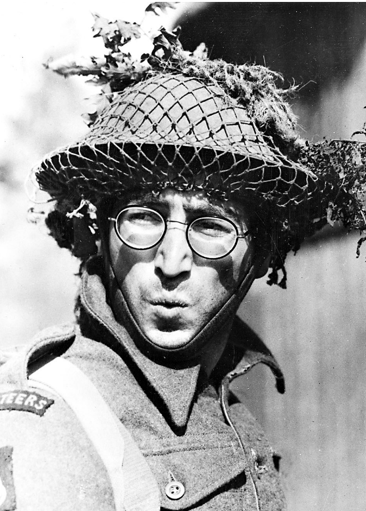
Джон Леннон в фильме «Как я выиграл войну». 1967 год.

Это было самое начало зимы. Около 11 вечера Джон Леннон возвращался из студии вместе со своей женой Йоко Оно. Они направлялись в отель «Дакота», где жили втроем с сыном Шоном. → стр. 10