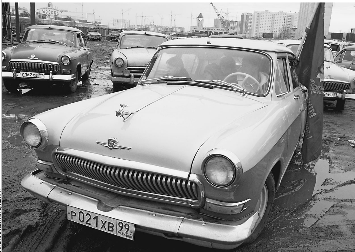
Легенда не дожила год до полувекового юбилея

Горьковский автозавод намерен прекратить выпуск автомобиля-легенды