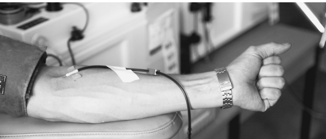
Доноры становятся опасными по вине медиков

Как проверяют донорскую кровь на безопасность ..... → стр. 3 В 1989–1991 годах впервые заразили детей ВИЧ-инфекцией в больницах Элисты, Ростова и Волгограда ..... → стр. 3 Что можно получить из крови ..... → стр. 3