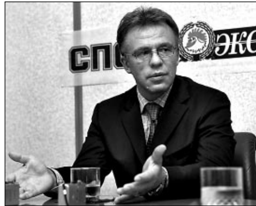
Роман ФЕДИНОВ - СЭ

Интервью с министром спорта России - стр. 8