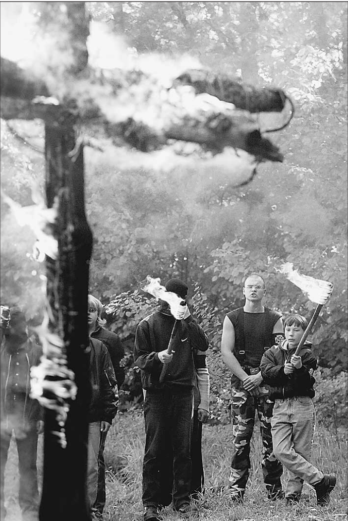
МЕЧТА. Такое же факельное шествие они хотят устроить 5 сентября на Тверском бульваре

Специальный репортаж читайте на 11-й стр.