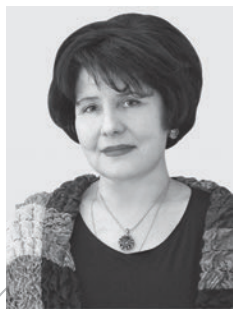
Татьяна Саакян, действительный государственный советник Российской Федерации 3-го класса