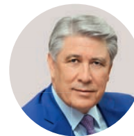
М. А. Эскиндаров Президент Финансового университета при Правительстве РФ