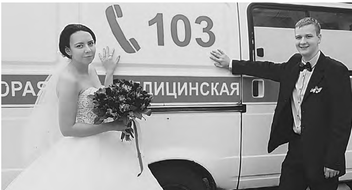
ИЗ СЕМЕЙНОГО АРХИВА ШЕЙНЫХ