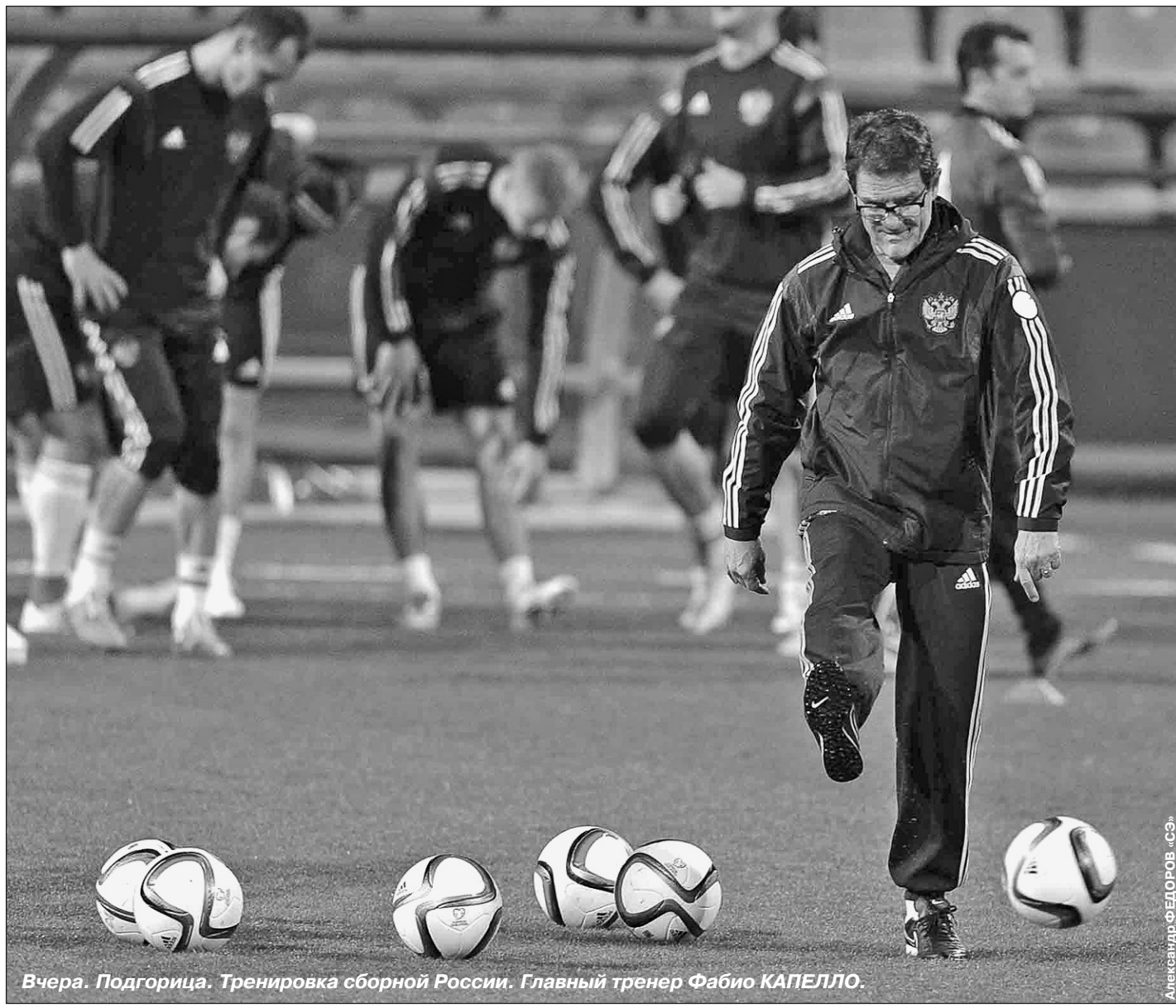
Вчера. Подгорица. Тренировка сборной России. Главный тренер Фабио КАПЕЛЛО.