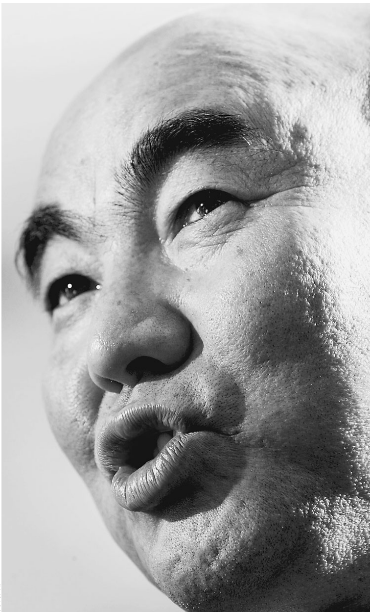
Аскар Акаев объявил о своей готовности уйти в отставку, если ему и его семье будут предоставлены гарантии безопасности

Между тем у здания парламента в Бишкеке продолжается акция протеста, организованная «Комитетом 27 марта», то есть той частью оппозиции, которую не устроили результаты революции. Манифестанты выдвинули «новой киргизской номенклатуре» список из 12 требований. В их числе — аннулировать итоги выборов и провести новые, сформировать кабинет без членов акаевской команды, сделать прозрачным бюджет... → стр. 2