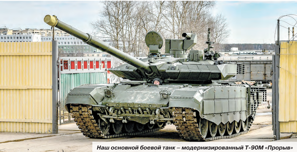
Наш основной боевой танк – модернизированный Т-90М «Прорыв»