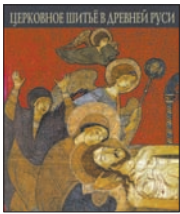
Церковное шитье в Древней Руси: Сб. ст.

2 Представить русское средневековое искусство без иконографии невозможно, как иконографию — без храмового убранства, шитья, плащаниц, подвесных пелен с «Распятием» и покровиц для литургических сосудов. Этих произведений дошло до нас очень мало, каждое уникально, оригинально, ярко и еще недостаточно оценено. Тут история древнерусского шитья предстает во всей своей красоте.