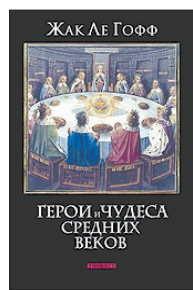
Ле Гофф Ж. Герои и чудеса Средних веков / Пер. с фр. Д.Савосина. М.: Текст, 2011 — 224 с.

5 На самой границе между историей и легендой, реальностью и воображением стоит смешанный мир, где живут настоящие и полумышленные средневековые персонажи: куртуазные рыцари и отважные короли, разбойники и святые, а также много-много сказочных существ. Их история под пером Ле Гоффа — история вдохновенных снов, что снисли европейской цивилизации.