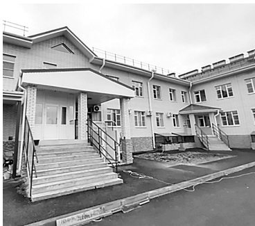
Современный детский сад примет сто ребятишек.