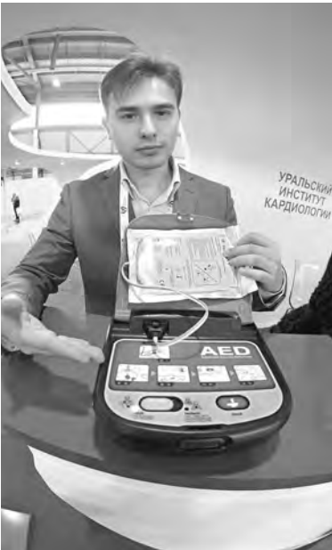
Компактные дефибрилляторы представили на международной выставке «Иннопром» в 2016 году.