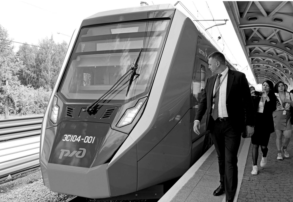
Новую «Ласточку» с обтекаемой кабиной оценили первые пассажиры.

В общем, заходить в ФНТП есть с чем: по данным профильного департамента, индекс сельхозпроизводства в АПК Тюменской