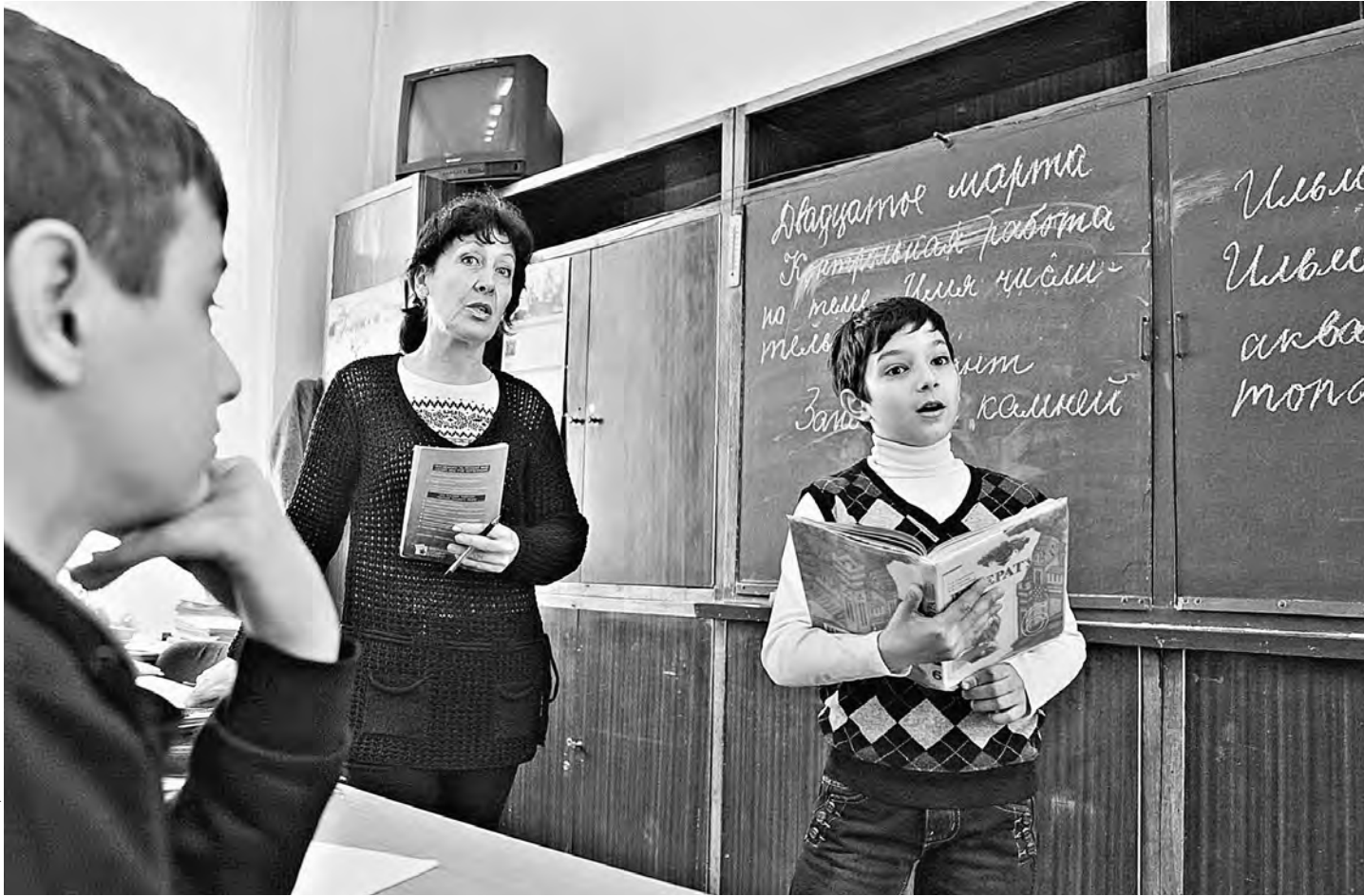
В керченской школе № 1 имени Володи Дубинина уроки русского языка никогда не прекращались.

Лариса Ионова, «Российская газета», Керчь