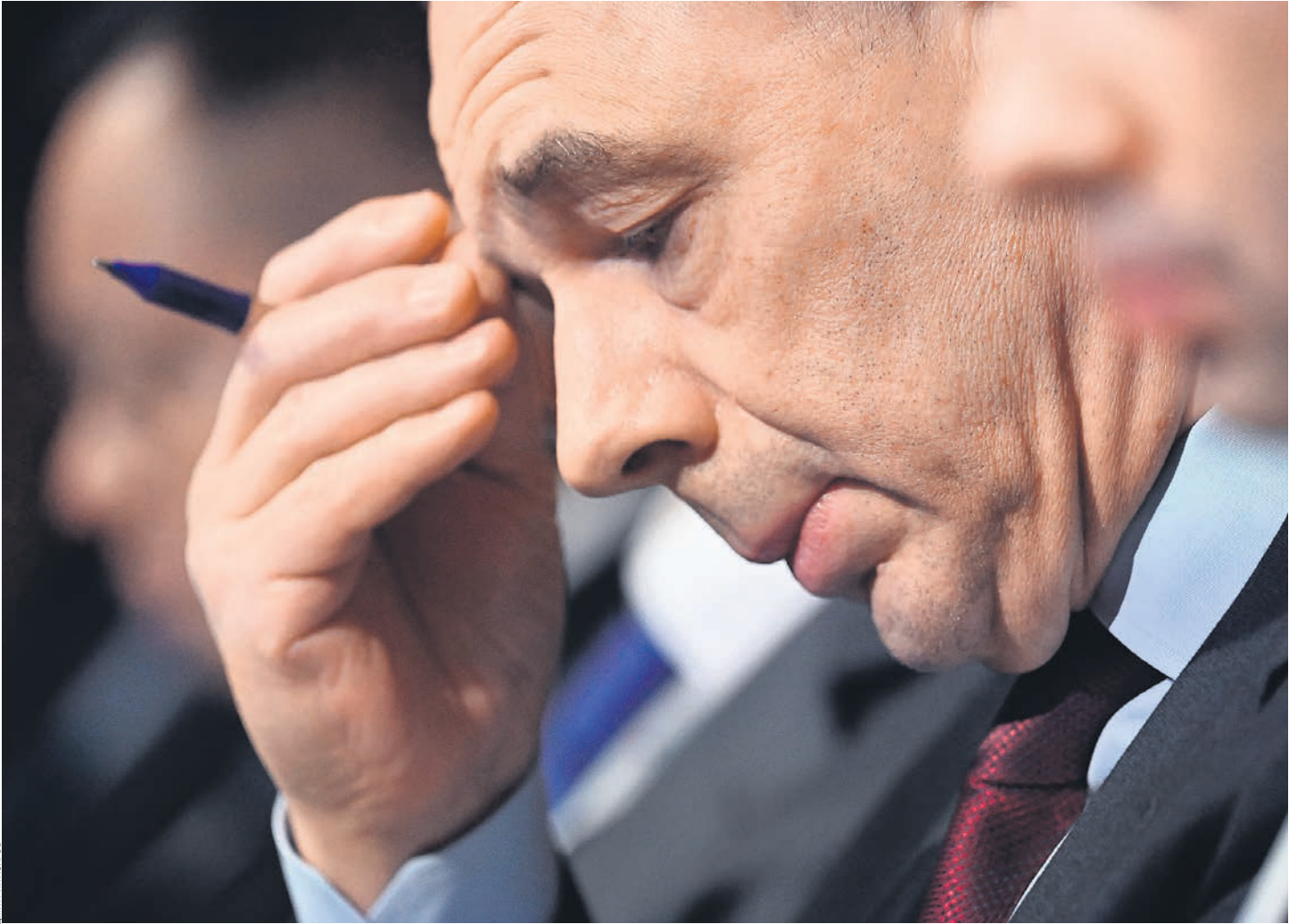
Из-за отказа иностранных юрисдикций от обмена финансовой и налоговой информацией с РФ Минфин под руководством Антона Силуанова будет только расширять черные списки

Партнер департамента налогового и юридического консультирования Керт Евгения Вольфус отмечает, что в списке появились юрисдикции, в которых номинальная став-