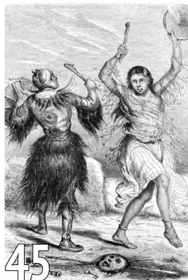
Почему верят шарлатанам