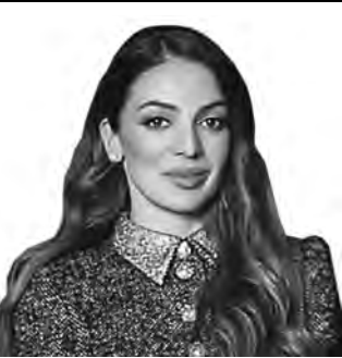
Зарина Догузова, руководитель Ростуризма:

— Поездки в города по популярности не уступают пляжному отдыху, и спрос каждый год растет. В городах, которые в этом году прошли конкурсный отбор, смогут на федеральные средства внедрить в туристических центрах единый архитектурный и дизайн-код, обновить в соответствии с ним вывески, навигацию и многое другое. Всего до 2025 года на поддержку туристических центров городов запланировано порядка 11 миллиардов рублей. И не забудем, что Крым и Кубань — главные курорты России — ожидают значительные инвестиции по итогам экономического форума в Санкт-Петербурге. Проекты этих регионов, получившие поддержку, также связаны с индустрией гостеприимства.