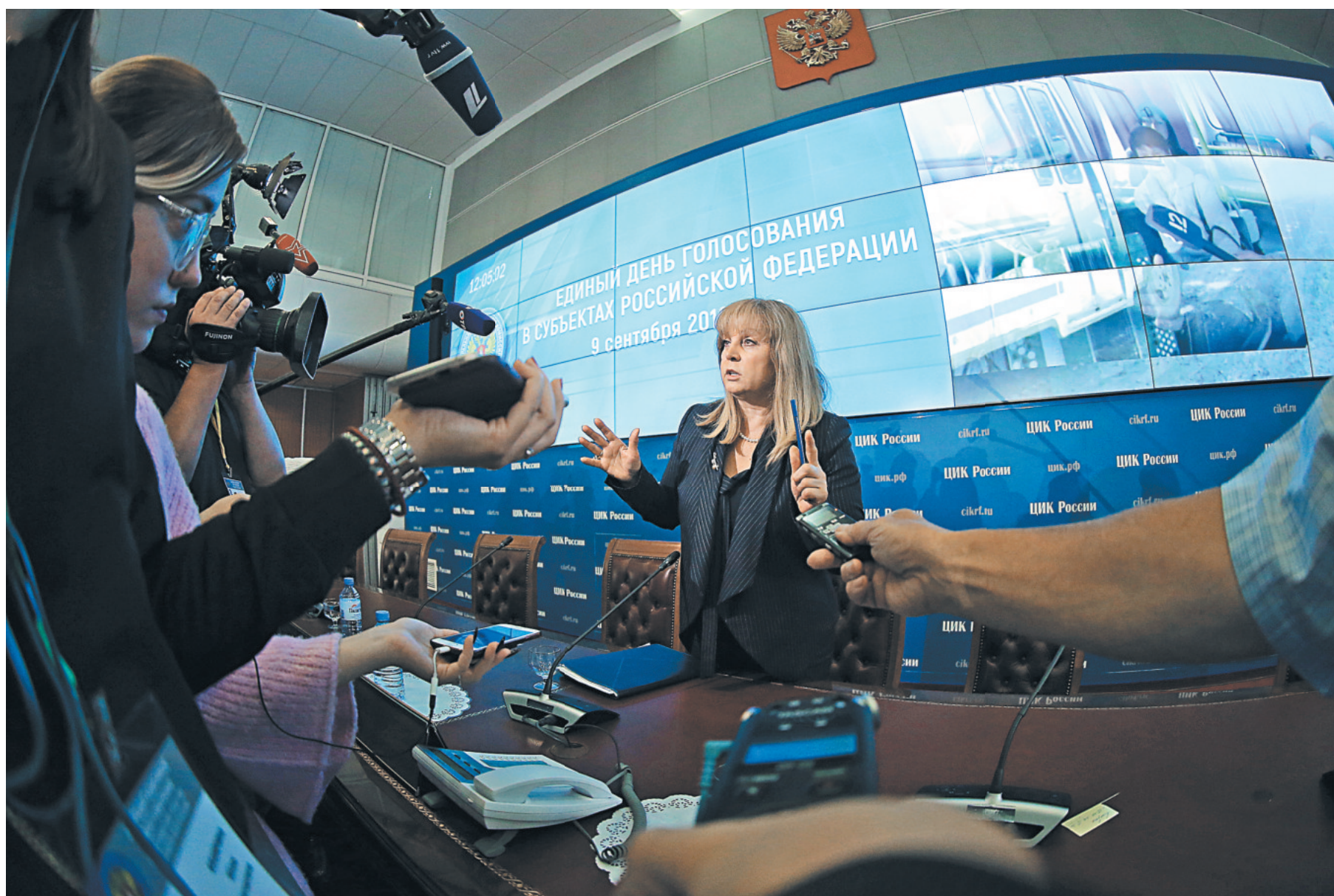
Элла Памфилова заявила, что в Центризбиркоме готовы ко вторым турам.

Татьяна Замахина Прошедшие 9 сентября региональные выборы носили конкурентный характер и были честными и «чистыми» — к такому выводу пришли Центризбирком, власть и политологи. Один из главных итогов этих выборов в том, что «Единая Россия» подтвердила свой статус основной политической силы страны. При этом другие партии сформировали запрос на увеличение своего присутствия в исполнительной и законодательной власти.