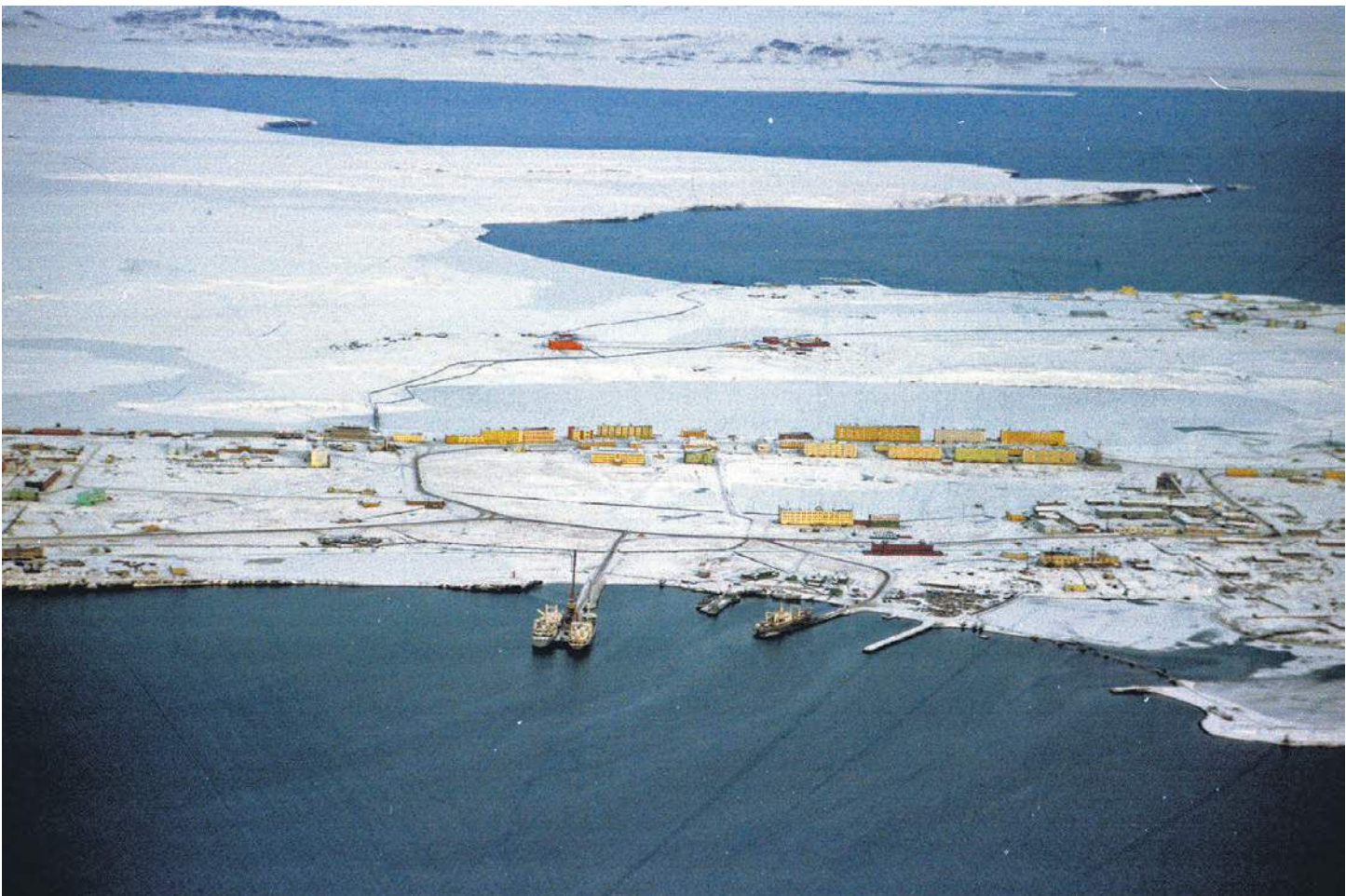
В России все чаще звучат голоса в поддержку испытаний ядерного оружия — например, на архипелаге Новая Земля (на фото). Но Владимир Путин считает, что время для этого еще не пришло

О том, что Россия могла бы дератифицировать ДВЗЯИ, чтобы уравнять ситуацию с США, Владимир Путин сказал, отвечая на вопрос одного из основателей клуба «Валдай», почетного председателя президиума Совета по внешней и оборонной политике Сергея Караганова. Политолог при этом спросил президента не о ДВЗЯИ, а о возможности изменения российской доктрины применения ядерного оружия в сторону понижения ядерного порога, чтобы, как он выразился, «отрезвить партнеров». Владимир Путин ответил, что не видит в этом необходимости. И обнародовал другое предложение: «повести себя зеркально в отношении с Соединенными Штатами», которые подписали, но не ратифицировали ДВЗЯИ, в то время как Россия сделала и то и другое. «В принципе зеркально повести себя с теми же Соединенными Штатами можно. Но это вопрос депутатов Государственной думы. Теоретически можно отозвать эту ратификацию. Если мы это сделаем, этого будет вполне достаточно»,— сказал президент.