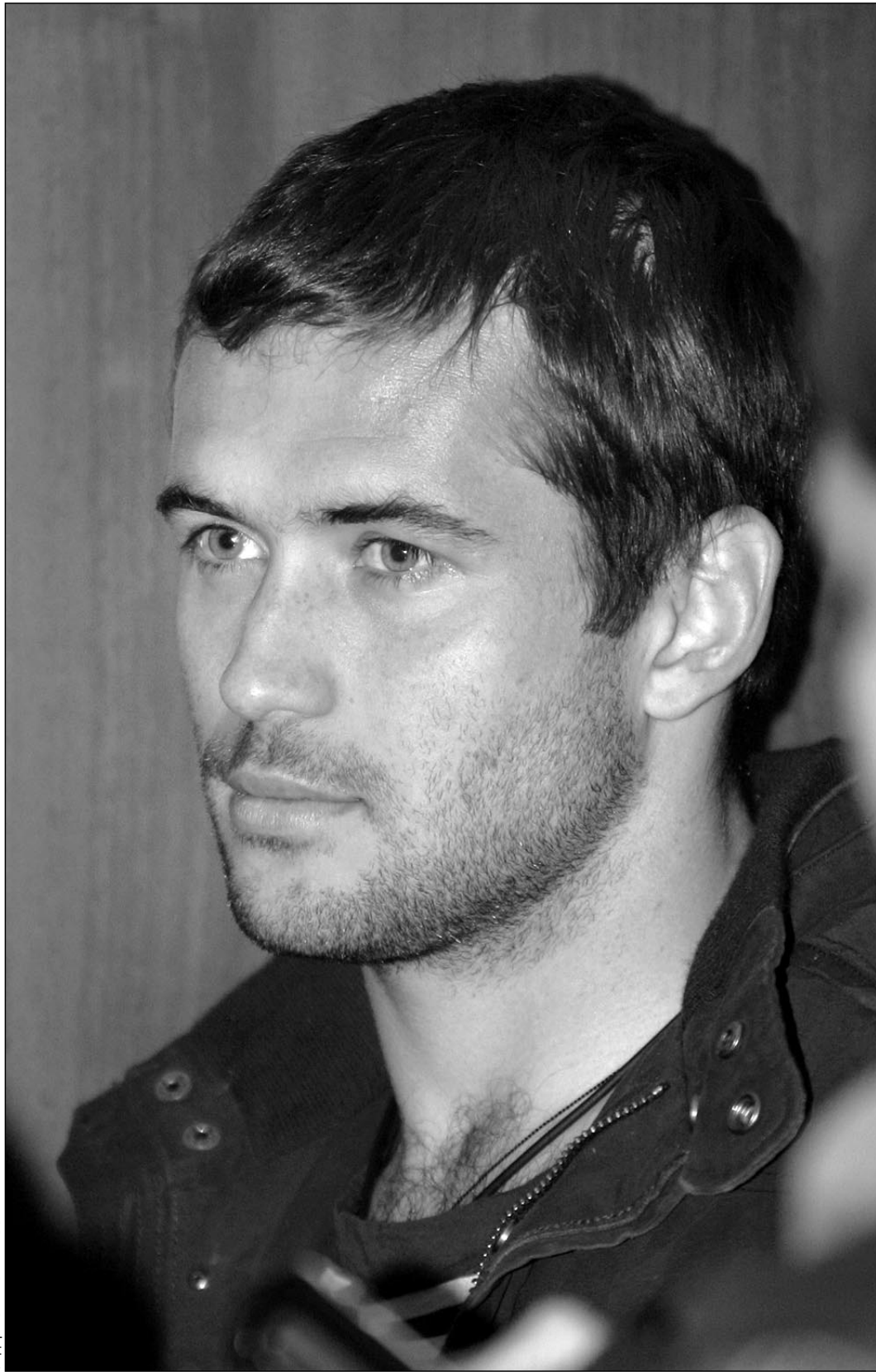
Вчера. Александр КЕРЖАКОВ.

Обращает на себя внимание отсутствие в составе Александра Кержакова. В то же время неожиданно можно считать вызов Павленко и особенно Иванова.