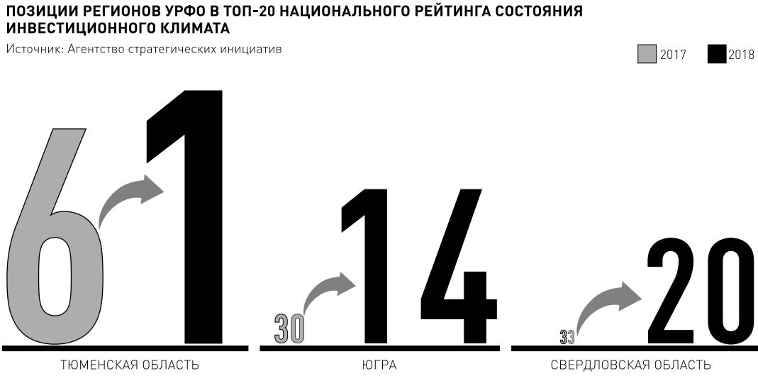
ИНФОРМАЦИЯ: РГ, ЕЛЕНА МАРЕР

ЕКАТЕРИНБУРГ: ул. Тургенева, 13, офис 820. Телефон/факс (343) 371-24-84, 355-30-68. E-mail: san@rg-ural.ru ТЮМЕНЬ: ул. Осипенко, 81, офис 1004. Телефон/факс: (3452) 35-24-94, 35-25-11. E-mail: man72@mail.ru ЧЕЛЯБИНСК: Свердловский пр., 60. Телефон/факс: (351) 727-73-33, 727-78-08. E-mail: chel@rg.ru