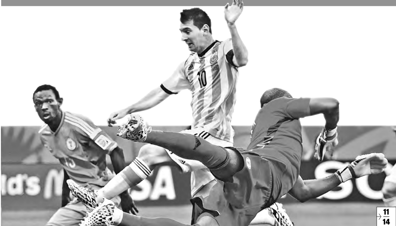
Едва отпраздновав день рождения, аргентинец Лионель Месси выдал очередной шикарный матч. И дважды поразил ворота Нигерии.

Проект Сколько времени врач должен тратить на прием больного