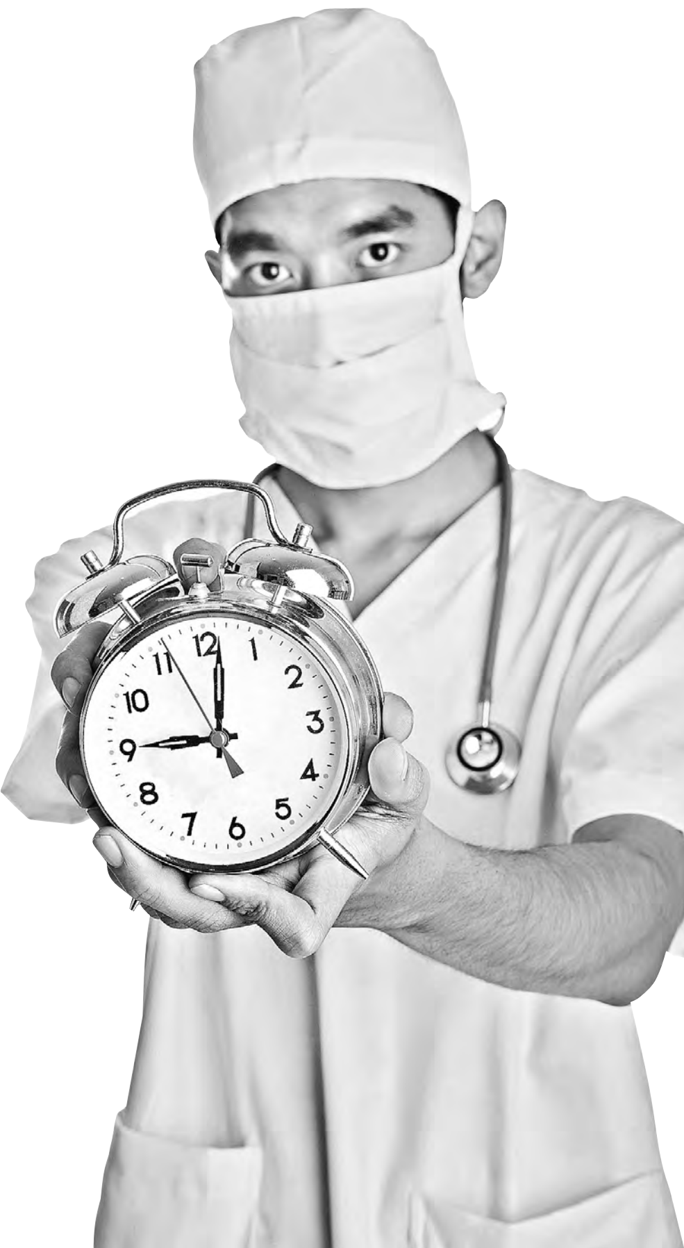
Никто не собирается стоять у врача с секундомером над головой и страдать: ни секундой дольше.

на одного пациента — это среднее время приема определили с помощью хронометража