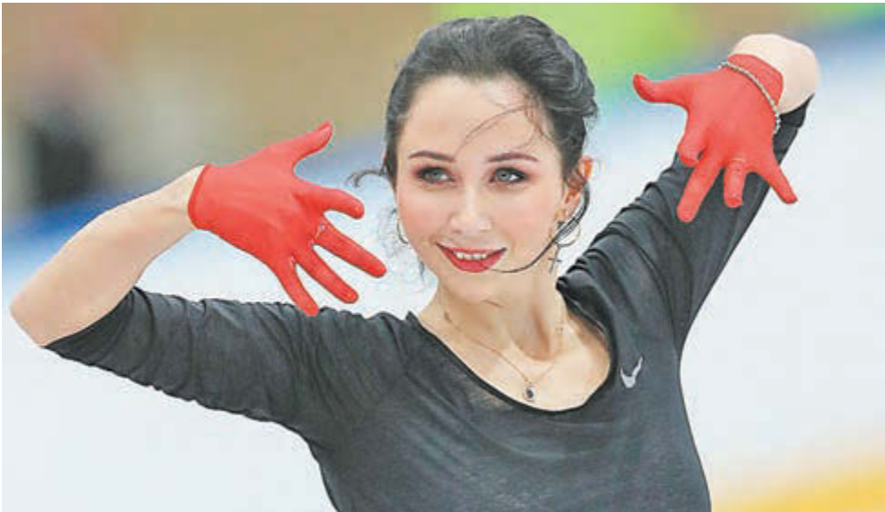
22-летняя Елизавета Туктамышева