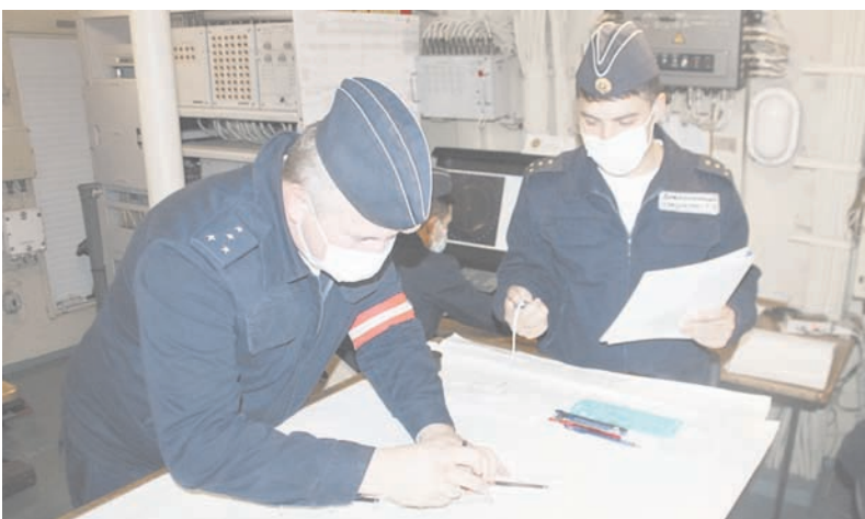
Тренировка под руководством дивизионного специалиста РТС.

Виктор МАКСИМЕНКО, фото автора и из архива соединения.