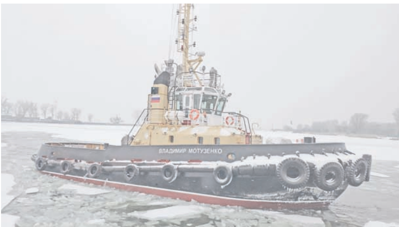
Одна из задач буксира – обколка льда в пунктах базирования кораблей.