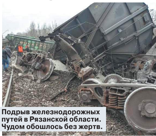
Подорыв железнодорожных путей в Рязанской области. Чудом обошлось без жертв.

Эксперт предрек долгую войну с украинскими диверсантами даже после окончания СВО