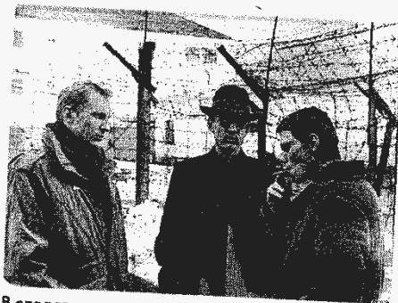
В следственном изоляторе