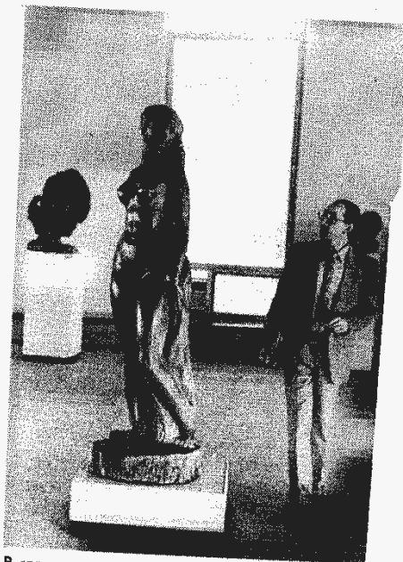
В саранском музее знаменитого скульптора Эрзи