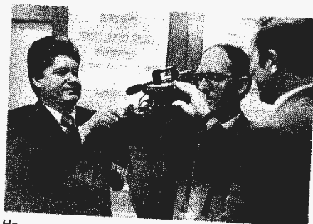
На вооружении мордовских следователей — новая японская видеотехника