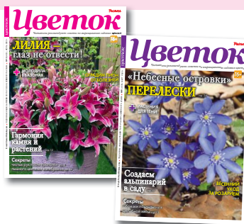
Реклама, УНП 192173221 ООО «Издательский дом «Толока»

ПОДПИСЫВАЙТЕСЬ НА «ЦВЕТОК» НЕ ВЫХОДЯ ИЗ ДОМА НА САЙТЕ: