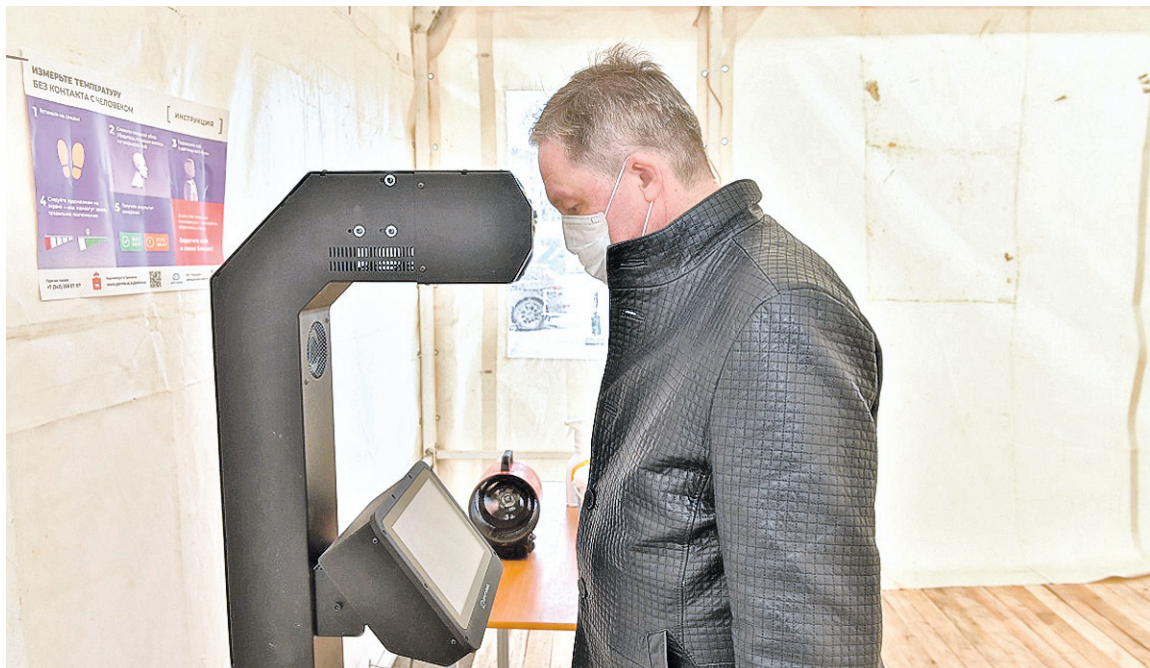
На центральном автобусном и железнодорожном вокзалах Перми обустроены термопункты для тепловизионного контроля прибывающих. Аналогичный пункт досмотра появился и для тех, кто уезжает из краевой столицы.