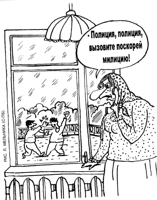
РИС. Л. МЕЛЬНИКА (С-ПБ)

Провинившихся полицейских будут переименовывать обратно в ментов!