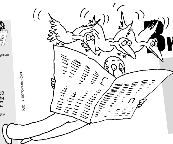
РИС. В. БОГОРАДА (С-ПБ)

Отпечатано в ОАО «ИПП «Уральский рабочий» Екатеринбург, Тургенева, 13 Подписано в печать 19.04.2011 Формат 60х84/8 Печать офсетная. Бумага для ВХИ. Усл.-печ.л. 3,26 Тираж 3030 экз. Заказ № 301