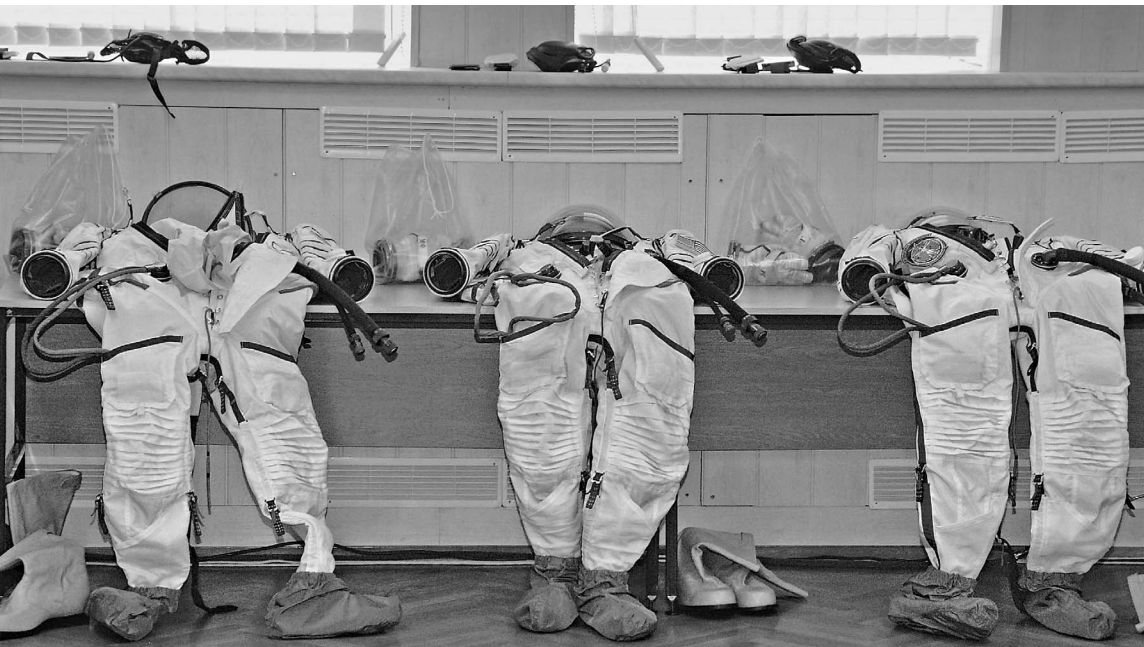
Возможность космонавтам проголосовать эксперты, в отличие от Бориса Грызлова, под сомнение не ставят

ОФИЦИАЛЬНЫЕ (ЦЕНТРАЛЬНЫЙ БАНК РФ) КУРСЫ ВАЛЮТ К РУБЛЮ НА 28 ЯНВАРЯ