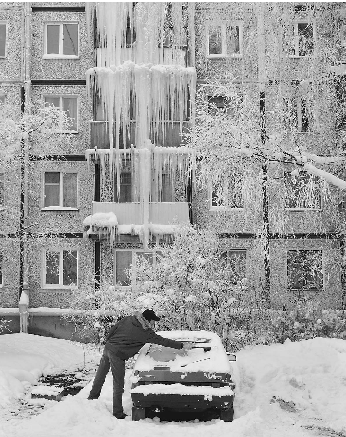
На обогреве домов очень хорошо заработали энергетики, а на уборке улиц — дорожные службы

Небывалые холода оказались полезны для экономики России