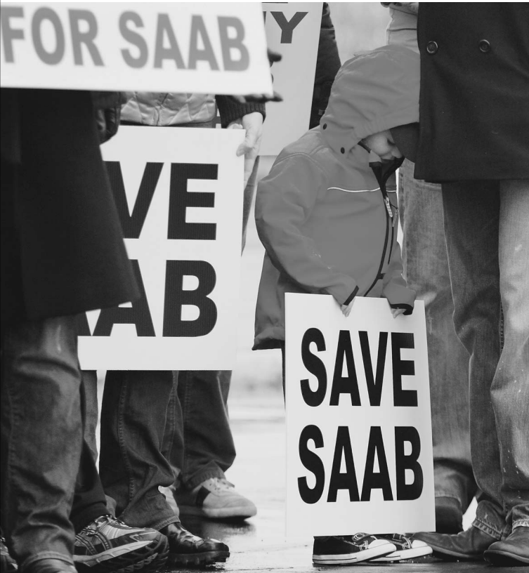
Рабочие Saab не против российских капиталов, в отличие от американских акционеров компании