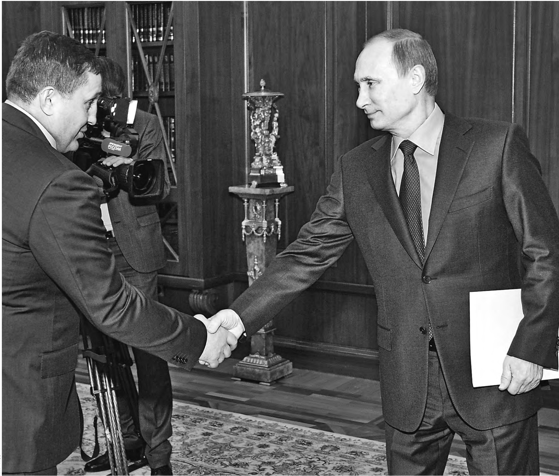
Президент, беседа с Андреем Бочаровым, заметил, что он хорошо знает регион, его вопросы, проблемы, которые там нужно решать.

Доверие властей у Бочарова есть. Теперь ему надо заслужить доверие населения, и для этого у него есть все возможности. Кстати, Бочаров до этого часто бывал в Волгограде. В кулуарах власти это называли «инспекционными поездками». Он проехал чуть ли не всю область, побывал во всех районах. Встречался с самыми разными людьми «на местах», расспрашивал о проблемах, надеждах и чаяниях, формируя для себя картину происходящего в регионе.