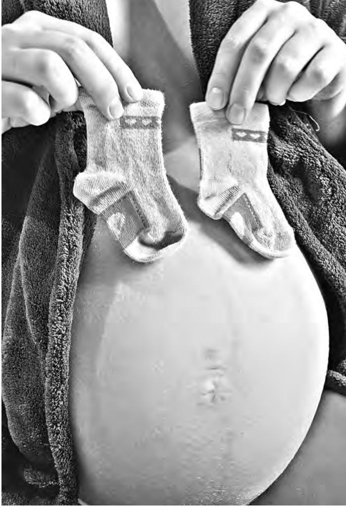
Регионы ждут прибавления.

А вот еще один совет. «Все более актуальной становится проблема нехватки мест в яслях, поэтому регионам рекомендовано принять меры по развитию систем ухода и присмотра за детьми в возрасте до трех лет», —